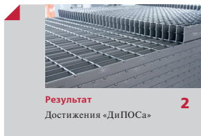
Результат 2 Достижения «ДиПОСа»