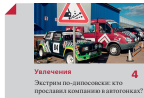
Увлечения 4 Экстрим по-дипосовски: кто прославил компанию в автогонках?