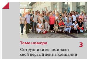
Тема номера 3 Сотрудники вспоминают свой первый день в компании